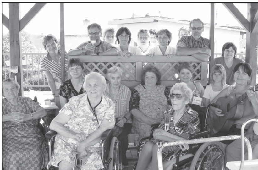
Dobrovolníci HHV v Domově pro seniory Lesnov