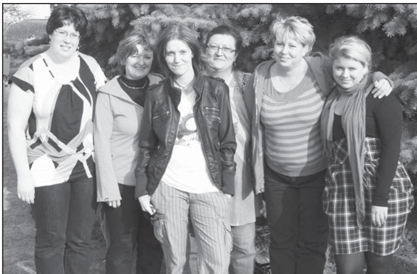
Středisko hospicové péče Jihlava