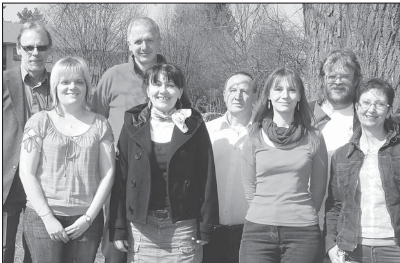
Středisko hospicové péče Nové Město na Moravě: